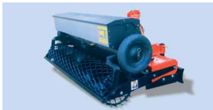
ME 1 con barra livellatrice ME 1 with levelling bar ME 1 avec barre niveleuse ME 1 mit Prallschiene