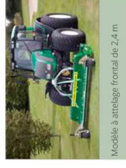
Modèle à attelage frontal de 2,4 m

Système de lame deux en un, rigide et en balancier