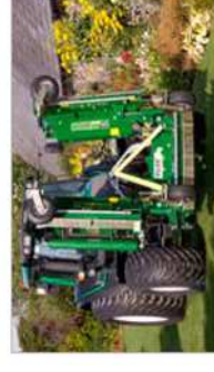
Position de transport