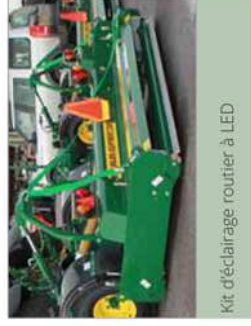
Kit d'éclairage routier à LED