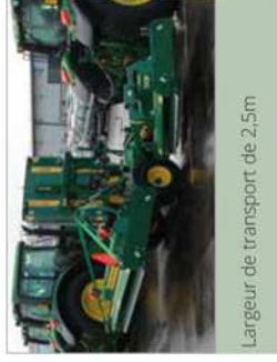
Largeur de transport de 2,5m